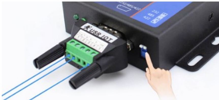
Ilustración 4: Posición del switch para funcionar con RS-485

Para activar el funcionamiento del puerto RS-485 en el USR-N510, se deben colocar hacia arriba los switches ubicados en la parte inferior del dispositivo. En la Ilustración 4: Posición del switch para funcionar con RS-485 , podemos verlo.