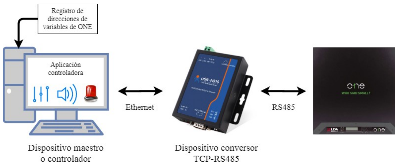
Ilustración 2: Funcionamiento de comunicación vía MODBUS RTU con ONE

Para ello se requiere la instalación del sistema, siguiendo la conexión que muestra la Ilustración 2: Funcionamiento de comunicación vía MODBUS RTU con ONE .