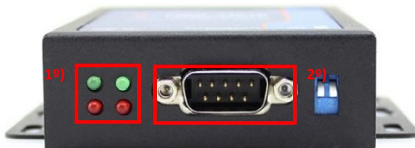
Ilustración 3: Posición de led de estado en la base inferior

Tras conectar la fuente de alimentación se encenderá el equipo y el led rojo PWR que se encuentra en el lateral del dispositivo (inferior izquierdo de los marcados en la Ilustración 3: Posición de led de estado en la base inferior como 1º). El resto de led hacen referencia al estado de trabajo en el que se encuentre el dispositivo.