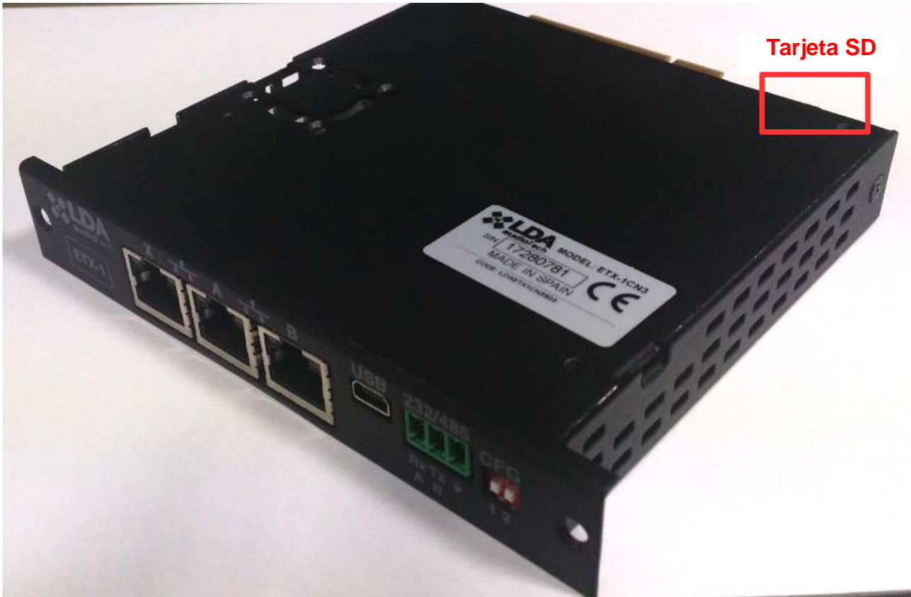
Ilustración 3: Tarjeta SD del módulo ETX

Retire cuidadosamente el módulo, extraiéndolo por las pestañas sobre las que estaba atornillado. Una vez suelto, podrá ver en la parte interior del módulo la tarjeta SD insertada ( Ilustración 3: Tarjeta SD del módulo ETX ). Para extraerla, basta con presionarla levemente.