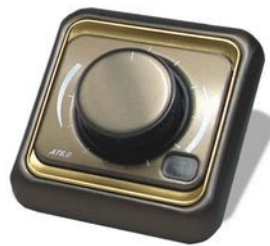
SIMON 75 SERIES