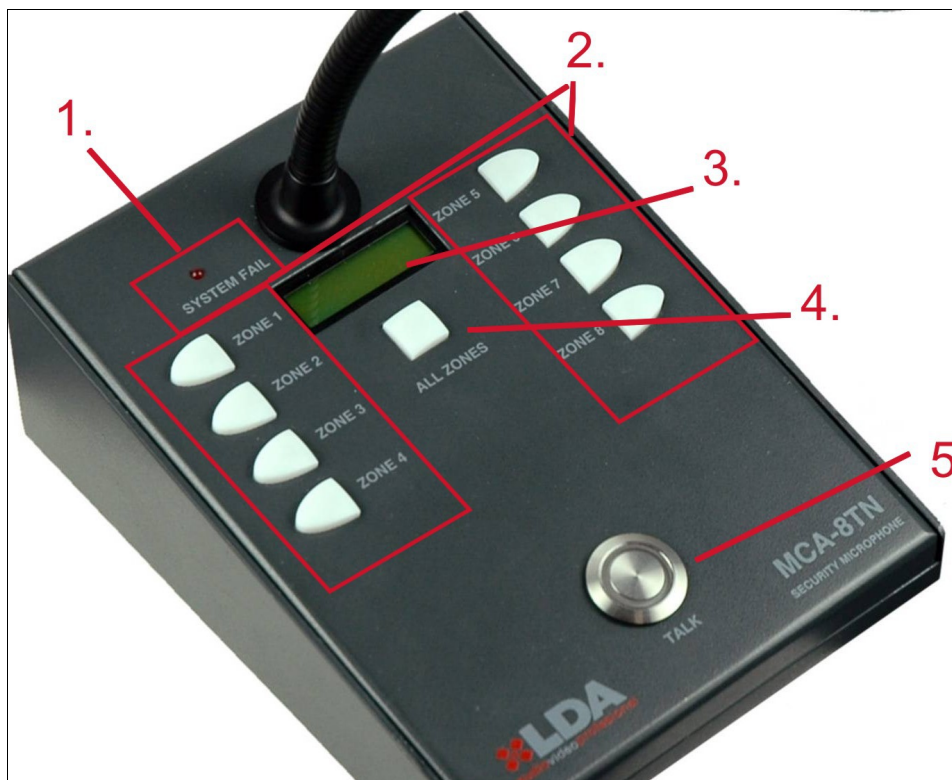
Ilustración 2: Frontal

En la parte superior del micrófono se encuentran todos los elementos necesarios para su funcionamiento normal. En la siguiente imagen se enumeran cada uno de ellos.