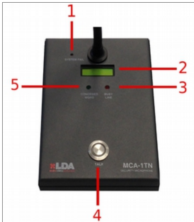
Ilustración 2: Frontal

En la parte superior del micrófono se encuentran todos los elementos necesarios para su funcionamiento normal. En la siguiente imagen se enumeran cada uno de ellos.